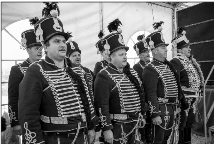
A Szentegyházi Hagyományörző Huszáregyesület műsora