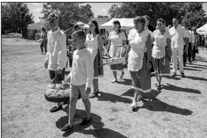
Népviselőbe öltözött hagyományörzők bevonulása