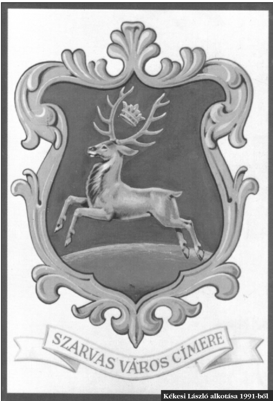
Kékesi László alkotása 1991-ből

szülöttjét, Kékesi László világhírű bélyegtervező grafikusművészt Szarvas ősi címerének rekonstruálására. Kékesi László jó szívvel fogadta a felkérést és visszaadva eredeti címerünk méltóságát, azt 1991-ben újjá alkotta. Az itt látható képeslapot jelen sorok írója – a Szarvas és Vidéke akkori főszerkesztője – nyomatta a Fazekas Nyomdában abból az alkalomból, hogy a dr. Demeter László polgármester vezette városi delegáció '91